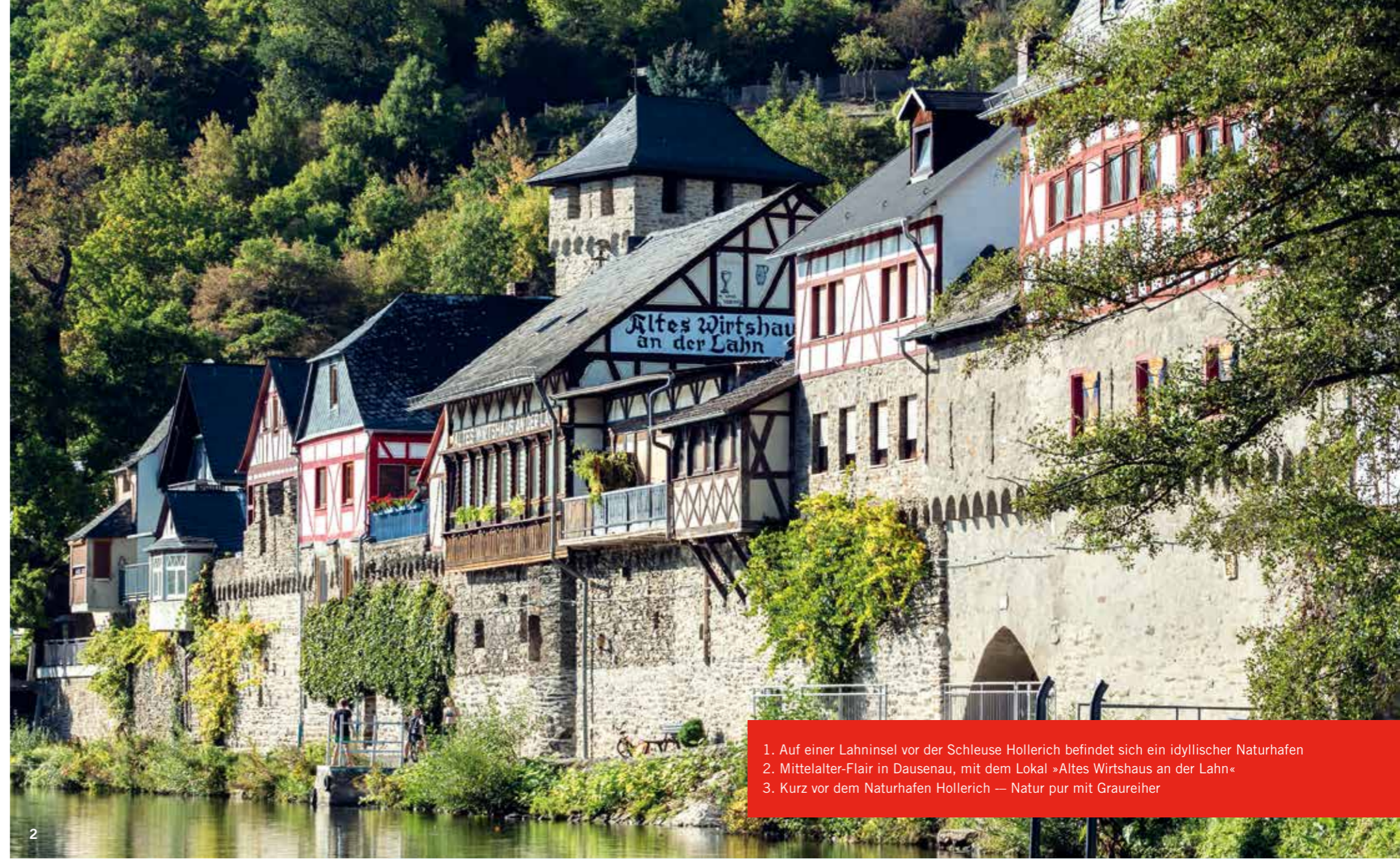
1. Auf einer Lahninsel vor der Schleuse Hollerich befindet sich ein idyllischer Naturhafen 2. Mittelalter-Flair in Dausenau, mit dem Lokal »Altes Wirtshaus an der Lahn« 3. Kurz vor dem Naturhafen Hollerich — Natur pur mit Graureiher

Fallhöhe vier Meter beträgt. Ab hier wird das Lahntal etwas breiter und der barocke Kurort Bad Ems kommt in Sicht. Einst erholten sich hier Zaren, Kaiser und Könige. Die viertürmige Sommerresidenz von Zar Alexander II., der von 1818 bis 1881 lebte, gehört neben der mit vier Zwiebeltürmchen und einer goldenen Zwiebel-Kuppel versehenen russisch-orthodoxen St. Alexandra-Kirche zu den meistfotografierten Motiven der Stadt. Die einzigartig prunkvolle Bäderarchitektur zieht jedes Jahr Tausende Erholungssuchende und Besucher an. Einige von ihnen suchen ihr Glück auch in Deutschlands ältester Spielbank, wo an Automaten, beim Black Jack oder Roulette gezockt werden kann. Kurz darauf befinden wir uns vor einer weiteren Staustufe und biegen backbords in einem schmalen Kanal ab, der direkt auf die Schleuse Bad Ems zusteuert. Wiederum wenige Meter backbords passieren wir den unter Skippern weithin bekannten Boots-Service-Kutscher und dahinter die sogenannte »Kutscher-Marina«, wo Inge und Heinz übernachten wollen. Tatsächlich bietet der idyllische Hafen einige ruhige Liegeplätze und ist in